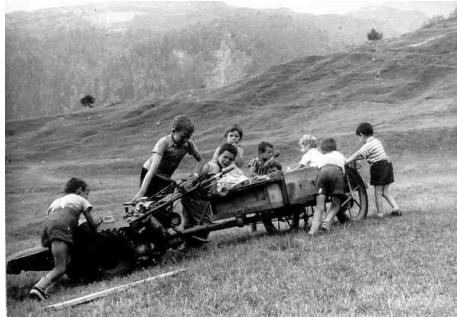
Kinder schleppen den ersten Traktor, der in Erschmatt eingesetzt wurde (Prumatt mit Traktor, 1958).

Zudem bestätigte die Vereinigung der Walliser Museen den Pilotstatus unseres Sammlungsprojekts innerhalb der kantonalen Datenbank, die derzeit entwickelt wird. Auf operativer Ebene wurden die Konturen eines ersten Pilotprojekts definiert: eine öffentliche Kampagne zur Suche nach materiellen Zeugnissen des dokumentarischen Erbes mit Schwerpunkt Fotografie. Ziel ist es, eine auf Spenden ausgerichtete Sammeldynamik zu entwickeln und die Voraussetzungen für deren Aufnahme sowie die zugehörigen Zeugnisse zu schaffen. Die Konzeption begann im Jahr 2025, der Start ist für 2026 in der Region Erschmatt geplant.