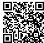
Lo Pan Ner

Dieses wurde in einer Ausstellung zur Degustation bereitgelegt. Die Vielzahl an unterschiedlichen Formen, Grössen und Geschmäckern war erstaunlich. Weiter nahm die Jury eine Bewertung der Brote vor und teilte diese den einzelnen Teams mit. Auf eine Rangierung der Backerzeugnisse wurde explizit verzichtet. Im Rahmen einer Solidaritätsaktion brachten die Dorfbackteams weitere Brote zum Verkauf mit. Der Erlös aus dem Verkauf ging an Blatten im Lötschental, das eigentlich auch an Lo Pan Ner teilgenommen hätte. Die erfolgreiche Premiere findet eine Fortsetzung: Lo Pan Ner 2026 am Wochenende des 7. und 8. November 2026 mit Rendezvous aller Dorfbackteams am Sonntag in Bruson im Bagnestal.