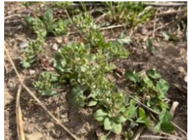
Ackermannsschild ( Androsace maxima ) im Schauacker