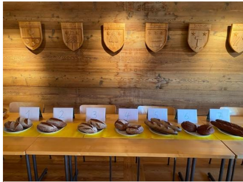
Ackerbohnenbrotdegustation im Rahmen des Projekts 'Ackerbau und Produktentwicklung im Berggebiet'

Beim Projekt 'Ackerbau und Produktentwicklung im Berggebiet' wurden die Ackerbohnen in Reinkultur in Erschmatt und auf einem Landwirtschaftsbetrieb in St. Léonard getestet. Die Anbautechnik funktionierte gut, jedoch stellte uns die Saatgutvermehrung vor einige Herausforderungen. Die Menge und die Qualität schränkten die Anbaufläche stark ein. Die Verarbeitung der Ackerbohnen war ein zweiter Schwerpunkt: in Zusammenarbeit mit der Roggenbäckerei in Erschmatt wurden Brote mit verschiedenen Anteilen Ackerbohnen erstellt und im Dezember von 15 Personen degustiert.