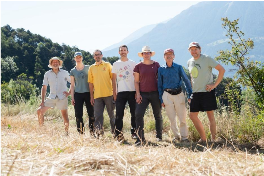
Team der Erlebniswelt Roggen Erschmatt

Das Natur- und Kulturerbe des Roggens fördern: Das hat sich die Erlebniswelt Roggen Erschmatt zur Hauptaufgabe gemacht. Um diese zu erfüllen, führt der Verein mit Sitz im kleinen Walliser Dorf Erschmatt seit 2003 eine Vielzahl an unterschiedlichen Arbeiten aus. Dazu gehört einerseits der Anbau von Roggen und Kulturpflanzen im Sortengarten und auf den sonnigen Ackerterrassen der Zälg. Über 1'000 Getreidesorten wurden unter anderem ausgestellt und unterschiedlichste Projekte zur Kulturvielfalt durchgeführt. Die Erlebniswelt Roggen Erschmatt führt andererseits den Brauch des Roggenbrots weiter, indem das selbst produzierte Getreide weiterverarbeitet und schlussendlich im Ofen zur Köstlichkeit geformt wird. Durch Führungen, Roggenateliers und Beratung erlaubt der Verein auch der Öffentlichkeit, die Gesamtheit des Roggens hautnah zu erleben.