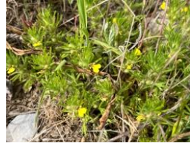
Gelbe Günsel ( Ajuga chamaeptytis ) im Schaugarten

In Zusammenarbeit mit den Naturpark Pfynges wurde ein Innotour-Projekt zum Thema 'Innovative Lehrpfade für die Schweizer Pärke' ausgeführt. Dabei wurden die bestehenden Grundlagen genutzt, um neue Ideen rund um die Vermittlung von Natur- und Umweltkenntnissen mit den folgenden Schwerpunkten zu sammeln: low-tech, analog, spielerisch und interaktiv. Anhand von diesen Ideen wurde eine konkrete Idee für einen innovativen Lehrpfad in der Zälg in Erschmatt rund um die Ackerbegleitflora erstellt. Erste Vorarbeiten für die Umsetzung dieses Lehrpfads wurden durchgeführt und im 2026 werden die Innovationen in der Zälg umgesetzt. Der Projektbericht wird allen Schweizer Pärken für die Erstellung von neuen Lehrpfaden zur Verfügung stehen.