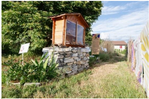
Eingangsbereich des Schaugartens 2025

Drei weitere Anlässe prägten das Jubiläum: der Of(f)entag im Mai, der Jubiläumanlass für die vielen Partner im Juni und die Premiere der Sortenvideos und der neu erstellten Sortengartenfilme im Dezember. Der Austausch stand an diesen Anlässen im Zentrum und die vielen Besucherinnen und Besucher schätzten dies sehr. Das Jubiläum trug den Titel 'Zeit zum Feiern und Erneuern'. So wurde im Verlauf des Jahres der Webshop neugestaltet, der Eingangsbereich des Sortengarten mit einem neuen Banner ergänzt und professionelle Fotos vom Sortengarten und ERE-Team von Raphael Wernli erstellt. Somit konnte die Öffentlichkeitsarbeit rund um die Walliser Sortensammlung verbessert werden. Einige der Fotos sind ebenfalls im Jahresbericht zu finden.