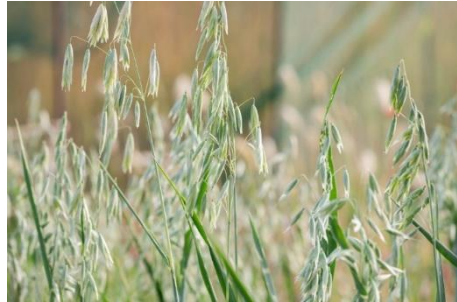
Hafer als Leitpflanze der Botanica Ausstellung im Sortengarten

Die Botanica stellt eine wichtige Werbepattform für unseren kleinen Garten dar, da jedes Jahr eine ausführliche Broschüre mit der Beschreibung aller botanischen Gärten erstellt wird und wir somit ein breites Publikum erreichen. Die Ernährung der Kelten war eine weitere Ausstellung, die wir in Zusammenarbeit mit dem Garten der heimischen Pflanzenwelt in Guttet und dem Heilkräutergarten in Albinen durchgeführt haben. Im Fokus standen Kulturpflanzen, die in Zeiten der Kelten wichtig für die Ernährung waren, und so pflanzten wir dieses Jahr auch Gemüse im Schaugarten an. Interessanterweise war der Roggen erst am Ende der Ära der Kelten relevant; Emmer, Einkorn, Gerste und Hirse bildeten die Grundlage der keltischen Küche.