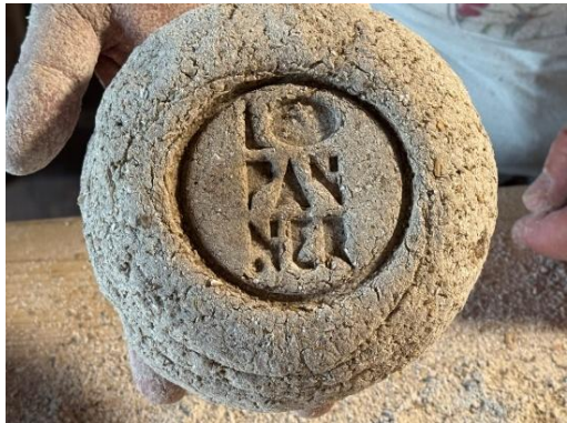
Handgemachtes Roggenbrot aus Erschmatt

Am Samstag, dem 18. Oktober, wurde in insgesamt 15 Walliser Dörfern Brot nach lokaler Tradition im eigenen Dorfbackofen gebacken, so auch in Erschmatt. Man konnte dort die Brotherstellung verfolgen. Der Höhepunkt folgte daraufhin am Sonntag. Zahlreiche Vertreter aus den 15 Dörfern reisten mit ihrem eigenen Brot im Gepäck nach Erschmatt.