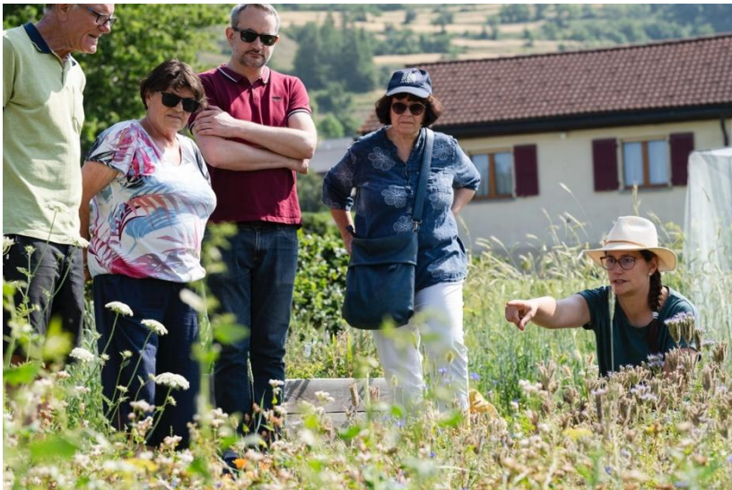
Führung im Sortengarten im Juli 2025