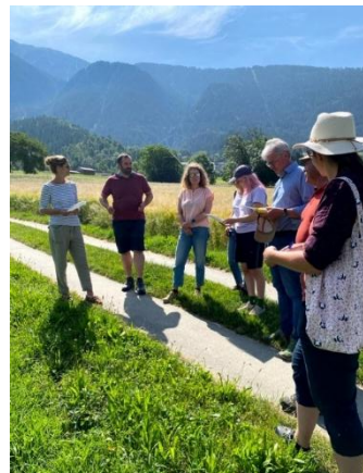
NAP Projekttreffen in Ried-Brig Mitte Juni 2025

Die dritte Ausstellung drehte sich um alte, vergessene Kartoffelsorten, die wir von ProSpecieRara erhielten. Wir pflanzten sechs Sorten mit interessanten Namen an: Ackersegen, Allerfrüheste Gelbe, Fläckler, Maritta, Spätrot und Carla. Der Kartoffelertrag pro Sorte war zwar sehr unterschiedlich, es sind aber alles feine Kartoffeln, die wir an den Mittagessen mit unseren Partnern an den verschiedenen Anlässen anbieten konnten. Es wird immer geschätzt, eigene Produkte aus dem Schaugarten zu degustieren. Die Forschungsarbeit rund um die Walliser Ackerbohnen wurde im 2025 weitergeführt. Der Fokus des NAP-Projekts 'Mischkultur von Ackerbohnen und Weizen im Alpenraum' liegt auf der Kombination der Walliser Ackerbohnen- und Sommerweizensorten auf der gleichen Parzelle.