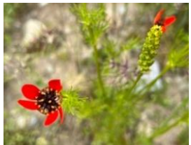
Blutsrote Adonis ( Adonis flammea ) auf den Ackerterrassen der Zälg