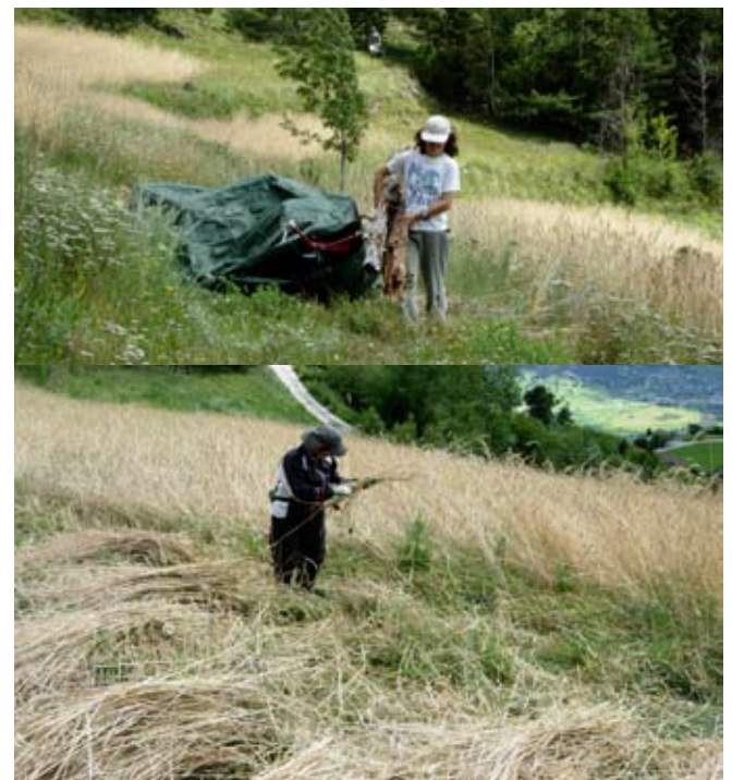
Freiwillige im Einsatz: Aufräumen und Ernten des Roggens von Hand (dort, wo er stark am Boden lag)

Seit einigen Jahren kann ich auf die Mithilfe einer Gruppe von Freiwilligen zählen, die mir die SUS (Stif-